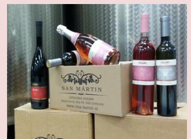
看板ワイン(左端がバルベラ)