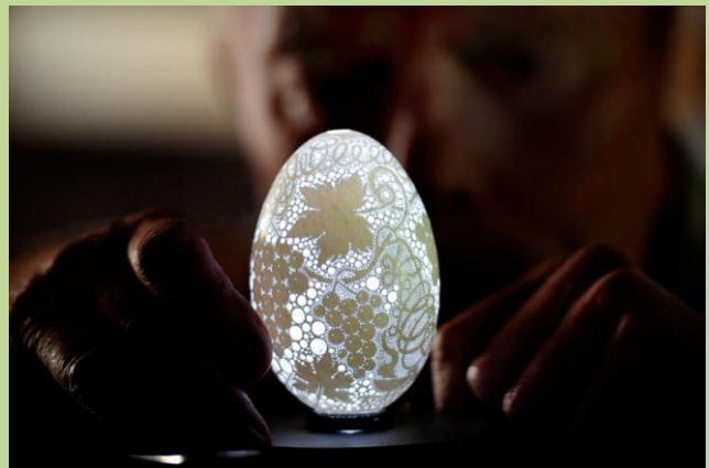
グロム氏製作のイースターエッグ